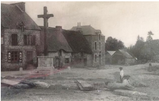
Aménagement de la Place de l'église vers 1930