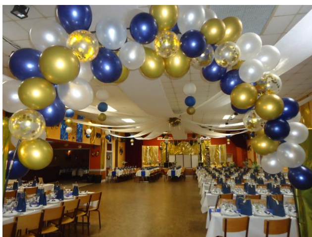
Salle de réveillon