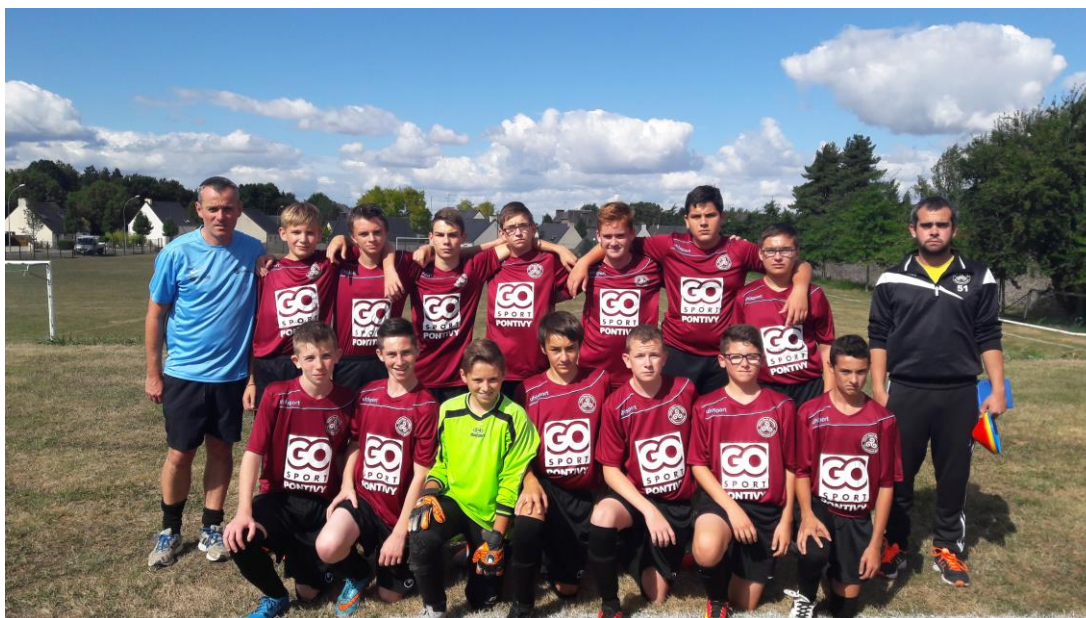
Une partie des 29 U15

Renseignements au 06-70-31-02-96 ou au 06-66-15-97-57.