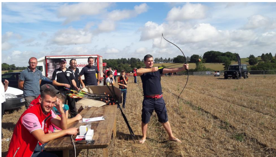
Tir à l'arc lors du ball-trap organisé les 10 et 11 septembre à Drénidan