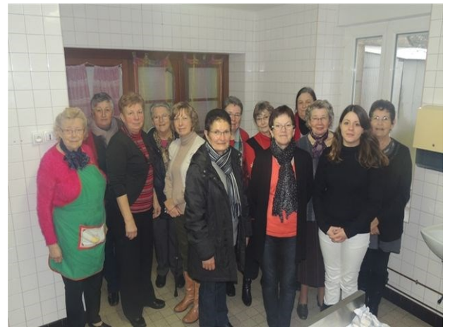
Cours de cuisine