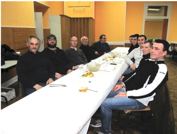
Jambon à l'os Vigilante