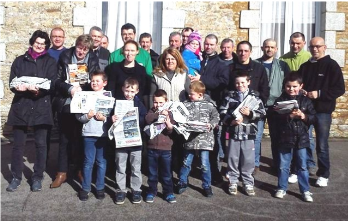
Collecte de journaux à l'école Saint-Louis