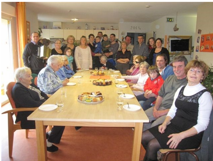
Réception des voisins au domicile partagé