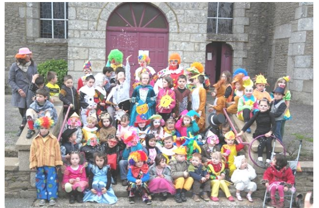
Carnaval école Saint-Louis