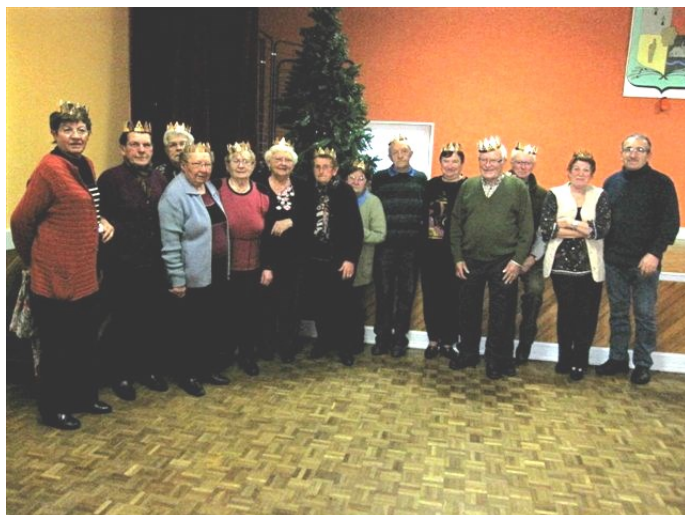
Galette du club des fougères