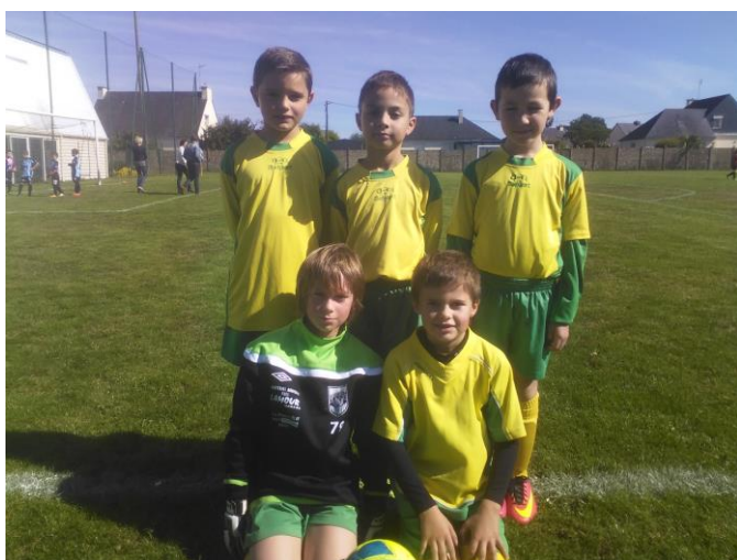
Equipe U9 à PLEUGRIFFET le 23 septembre