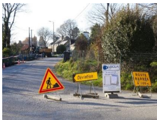
Travaux de renouvellement du réseau eau potable à Cassac

De nouveaux jeux ont remplacé les anciens à la salle communale ainsi qu'au plan d'eau.