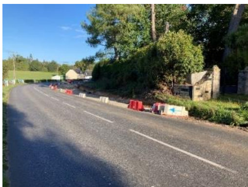
Travaux pont de Saint-Fiacre