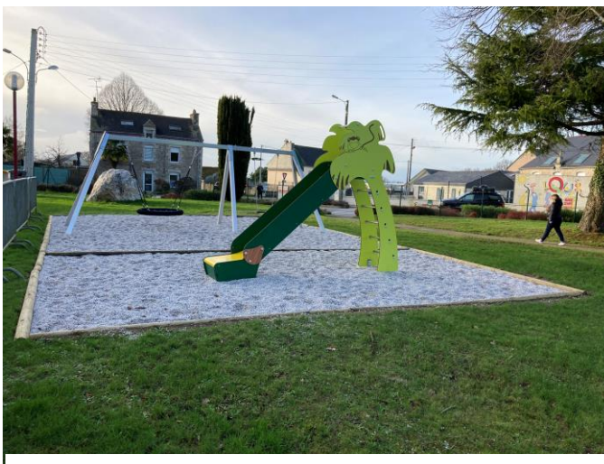
NOUVELLE AIRE DE JEUX à la salle communale