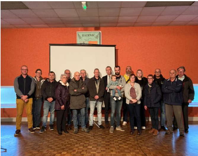
CÉRÉMONIE DES VŒUX 2023 : les présidents d'association