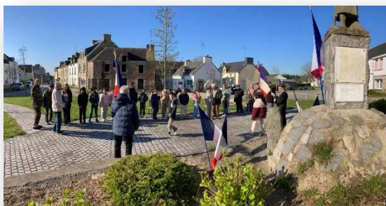
Commémoration du 19 mars