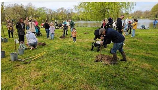
Plantation des arbres fruitiers pour les naissances de 2025