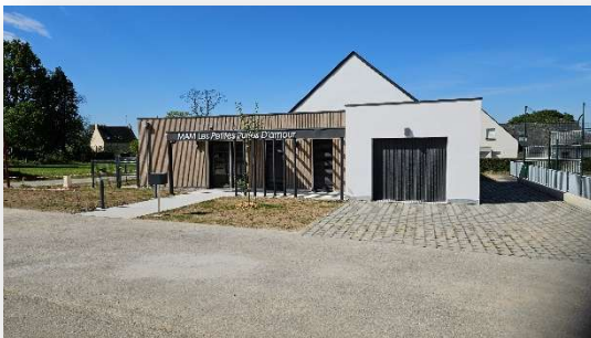
L'ouverture de la Maison des Assistantes Maternelles le 2 mars 2026

Horaires d'ouverture : du mardi au vendredi de 9h à 12h30 et de 13h30 à 17h15 et du samedi de 9h à 12h